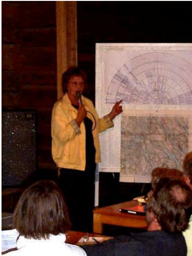
Släktforskningen i Strömstrakten